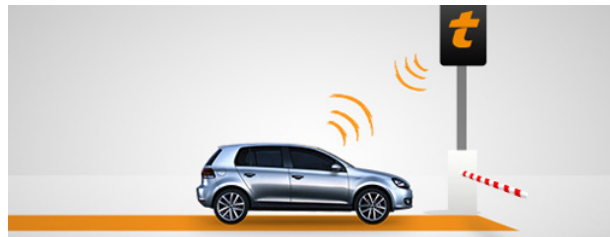
Illustration : APRR

Un modèle entité-association (EA) se compose d' entités (rectangles) reliées entre elles par des associations (losanges). Chaque lien a une cardinalité ( e.g. 1 ? * +). Entités et associations ont des attributs (ovales) qui représentent des données.